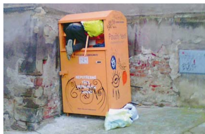
DALŠÍ ODMĚNĚNÉ FOTO. Další fotografii nám zaslala Šárka Klírová, která ji nazvala „Žižkovský hledač pokladů“. Za fotografií její autorce posíláme CD Miroslava Žbirky s autogramem zpěváka.