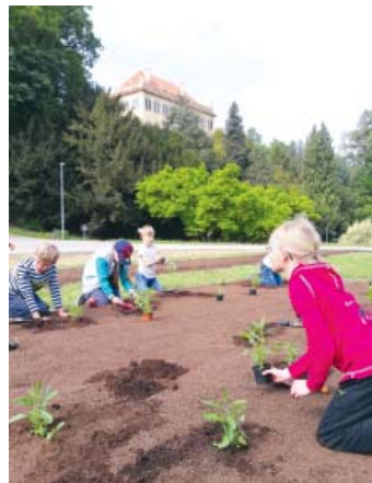
ZÁBAVA. Děti se během sázení dozvěděly nejen něco o historii Stromovky, sázení je bavilo.

Stromovka - Záhony na parteru před Šlechtovou restaurací ve Stromovce jsou do doby dokončení rekonstrukce objektu Šlechtovky provizorně zakládány z přímých výsevů a jsou doplňovány letničkami z předpěstované sadby. Již čtvrtým rokem odbor ochrany prostředí pražského magistrátu k této činnosti zve školní děti. 18. května se ve Stromovce vystřídaly hned tři třídy z nedaleké Fakultní ZŠ Umělecká. Děti si mohly vyzkoušet celý postup založení květinových záhonů z letniček